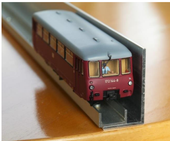
Gabarit avec un véhicule vue de face