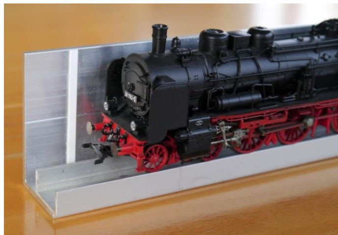
Extrémité du gabarit avec point de contrôle (0,5 mm)