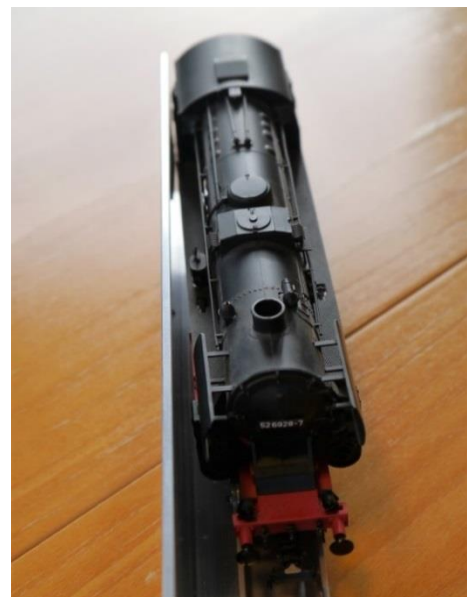
Loc (sans Tender) en position déportée avec un jeu latéral inutile à tous (!) les essieux