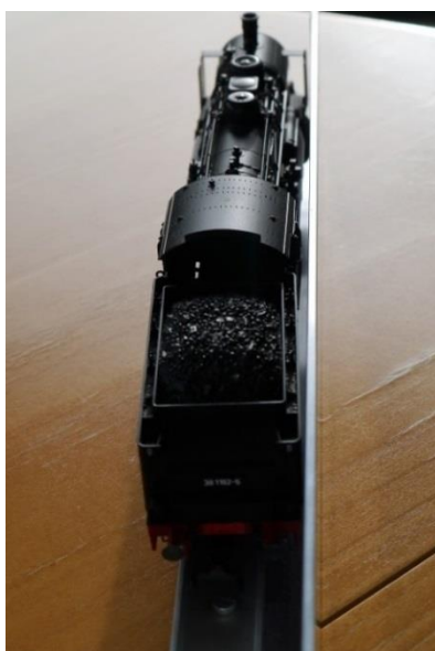
Loc avec tender avec tous (!) les essieux en position déportée max.